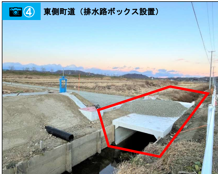
④ 東側町道（排水路ボックス設置）