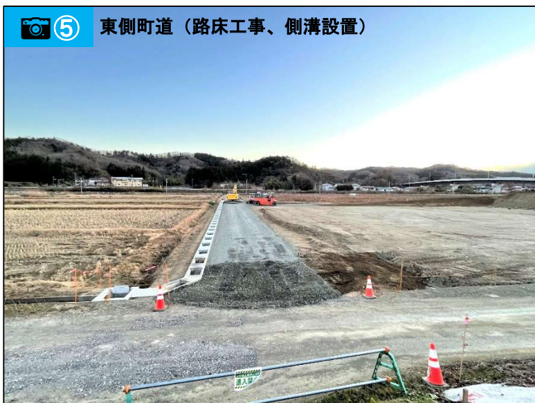
⑤ 東側町道（路床工事、側溝設置）